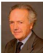
E. Carmignac Gérant